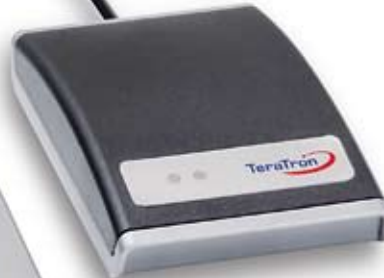
PC-LOC® Leser mit USB-Kabel