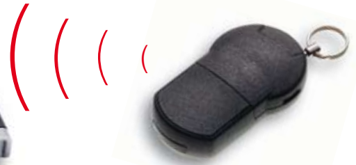
Aktiver PC-LOC® Schlüssel